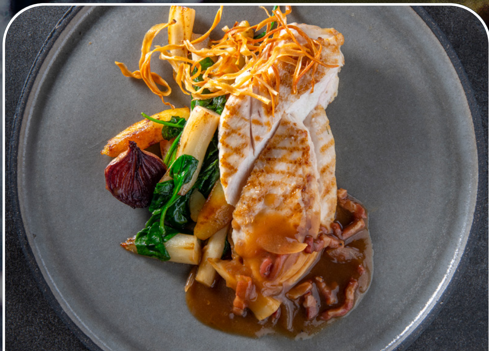
Fonds & Jus