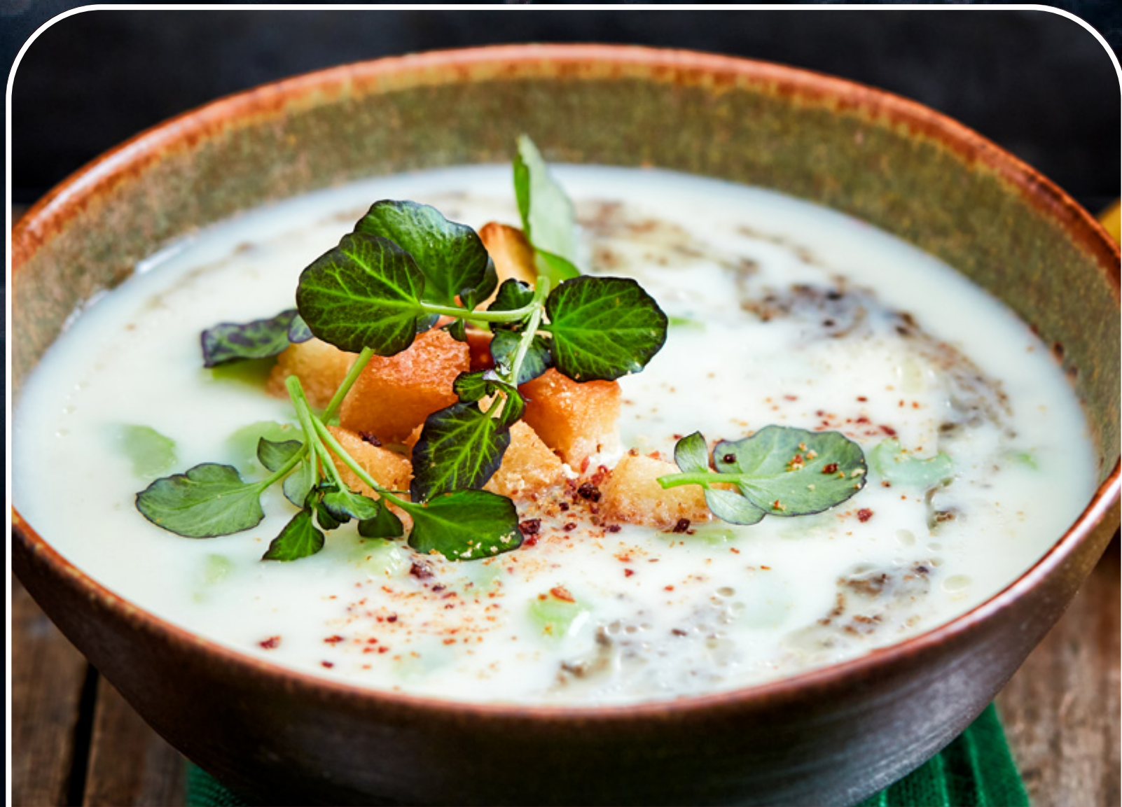
Soepen & Soepverrijkers

Jouw gerechten verdienen de beste ingrediënten